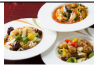
桃翠おすすめランチ

■ あぐー豚の酢豚 ¥2,100 ■ エビと野菜塩味炒め ¥2,100 ■ 五目揚げスープ麺 ¥2,100 (前菜3種・スープ・スイーツ・コーヒー付) ※その他のセットメニューも多数ご用意しております。 ※10月より毎週水曜日は定休日となります。