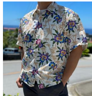
NEW! 竹模様にイジュが躍る