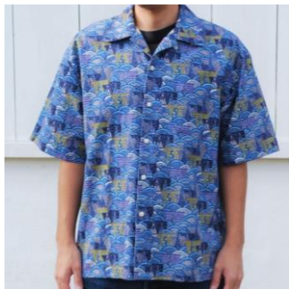
青海波に帆掛け船

知念紅型研究所とコラボレーションした、かりゆしウェア。琉球びんがたの伝統ある古典柄を同工房10代目知念冬馬に、特別に配色をしてもらい、デジタルデータ化してバガス生地プリントしました